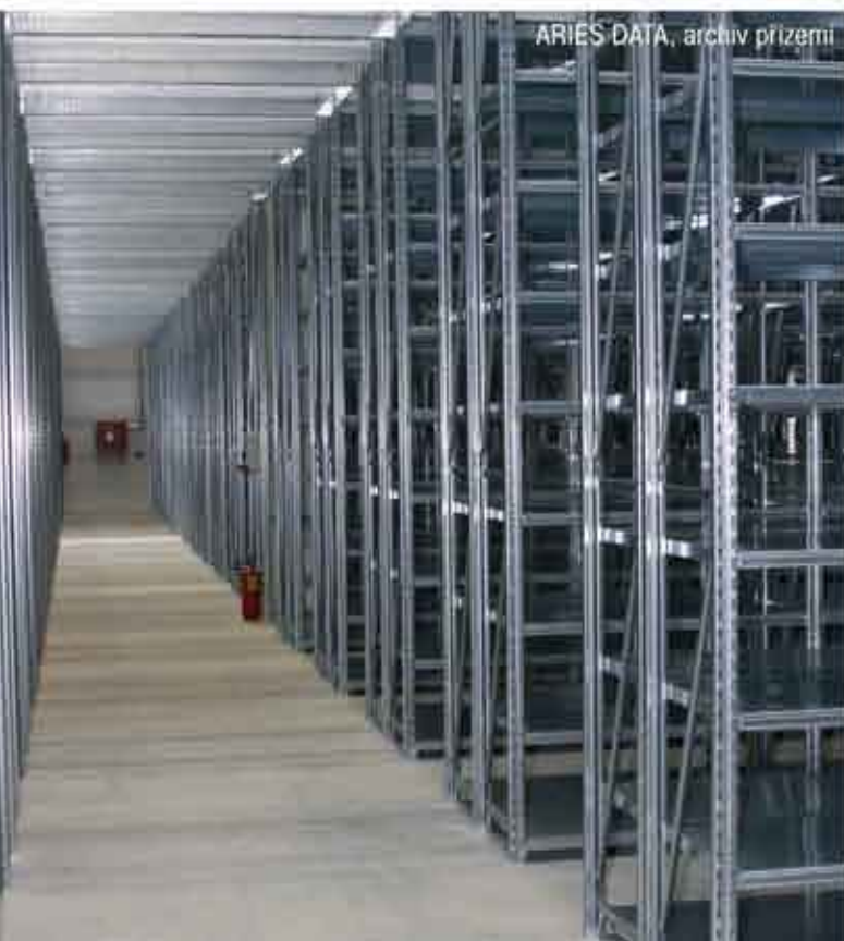
ARIES DATA, archiv přízemí